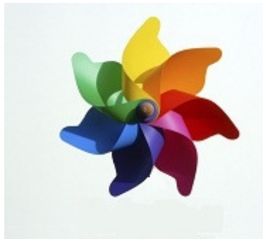
[Logotipo de la Empresa]

Se decidió nombrar [Nombre de la Empresa] a la empresa porque [Razón del Nombre de la Empresa]. Lo anterior se ve resumido en su logotipo.