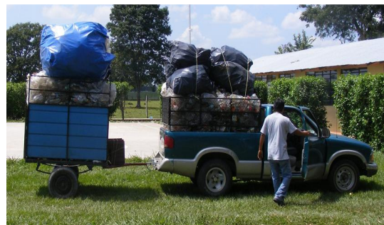
Imagen 2. Camioneta y Remolque

Si este es el caso, se debe considerar al menos una camioneta y su remolque para transportar el material.