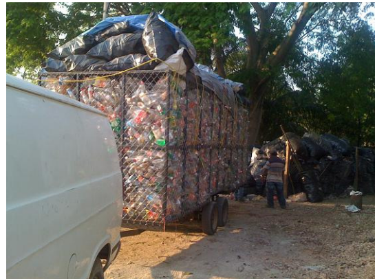
Imagen 1. Transporte mediante remolque para envases de PET

El material puede llegar a la planta ya sea mediante el transporte del proveedor o bien por el transporte del Centro de Acopio.