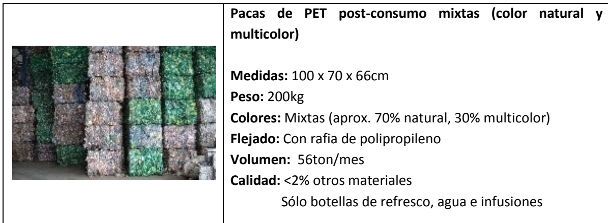
Tabla 2. Producto del Centro de Acopio

El producto principal de este proyecto es el PET en pacas mixtas (PET color natural y multicolor), que es la materia prima para aquellas empresas que lo reciclan para generar hojuelas limpias (lavadas en frío, lavadas en caliente) y que posteriormente se empleen en la fabricación de productos como: gránulos ( pellets ), fibra poliéster, textiles, etc.